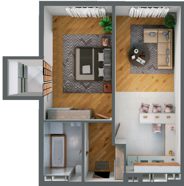
Планування квартири з меблями