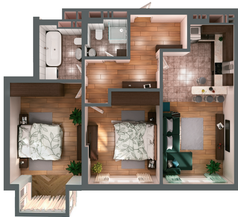
Планування квартири з меблями