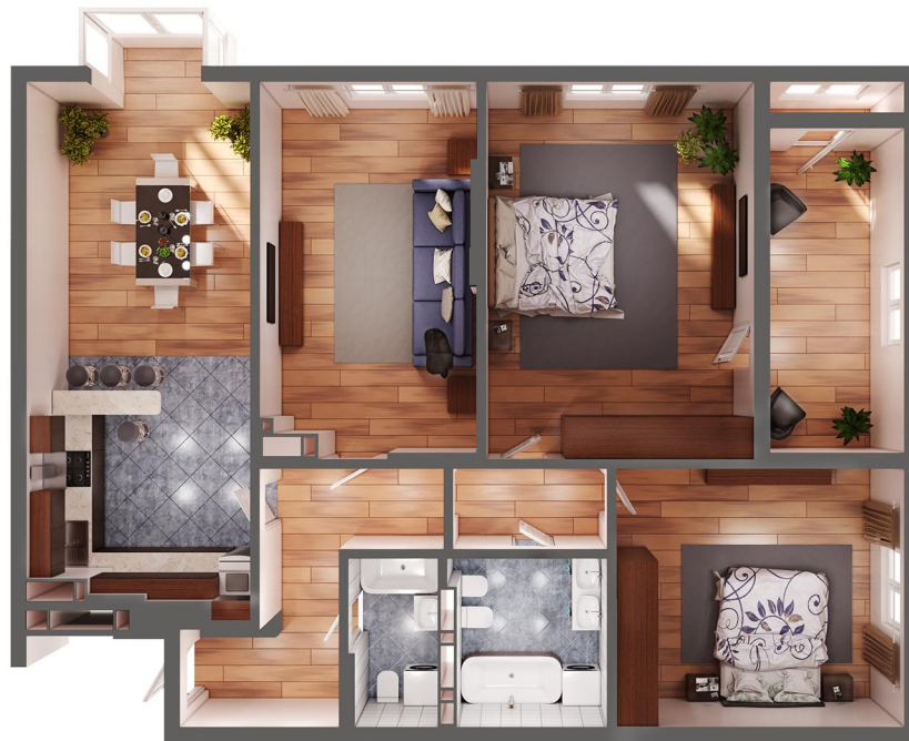
Планування квартири з меблями